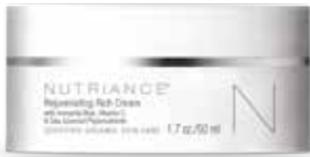
Codice 369 | 50 ml